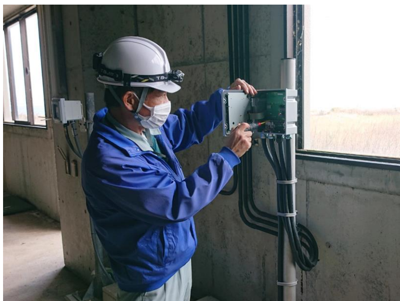
水質監視機器(有機汚濁度) メンテナンス